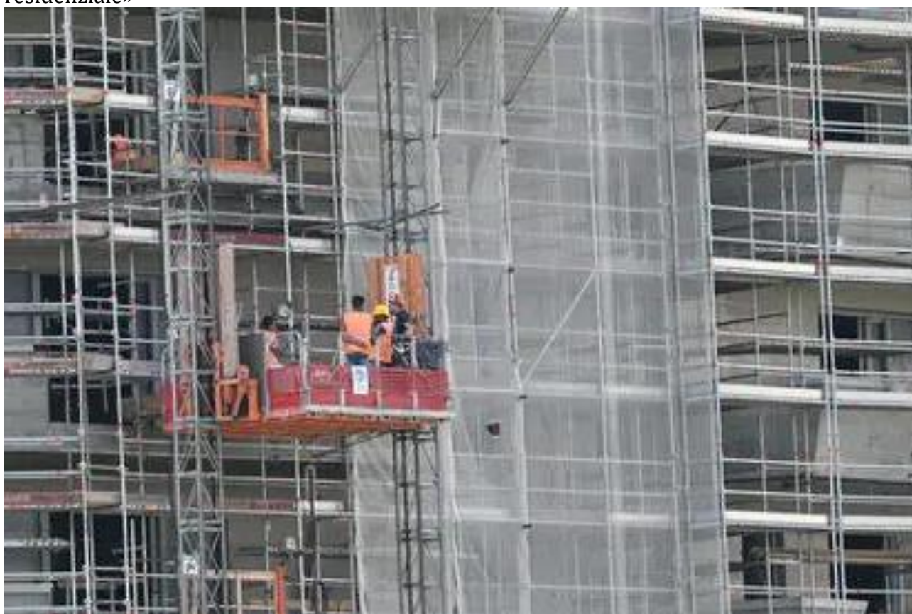
Operai al lavoro in un cantiere

Resiste il settore pubblico grazie al Pnrr. La Cna: «Prospettive incerte nel 2025 soprattutto sul residenziale»